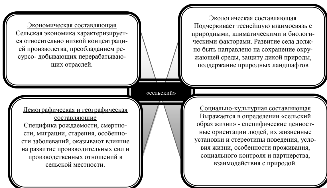
Рис. 2. Многоаспектность категории «сельский»

Понятие «сельский» включает в себя рассмотрение различных аспектов, его составляющих (рисунок 2).