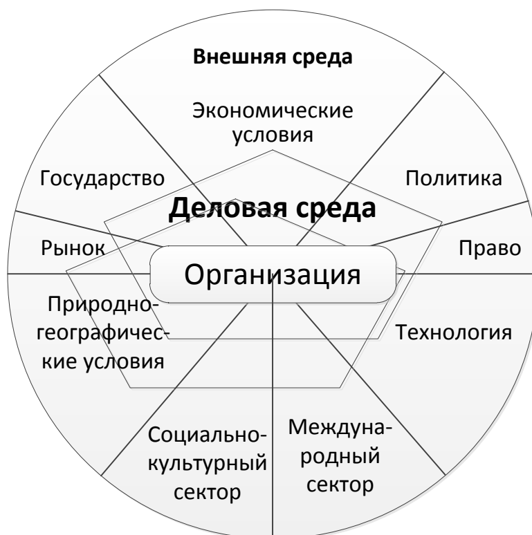
Рис. 1. Изменение деловой среды организации

Деловая среда формируется в процессе деятельности организации и меняется со временем. В некоторых случаях факторы внешней макросреды начинают оказывать сильное влияние на конкретную организацию и становятся частью ее делового окружения. Деловая среда изменяется, если организация меняет стратегию, сферу деятельности, производимые продукты и т.д. Изменение деловой среды организации можно представить на рисунке 1.